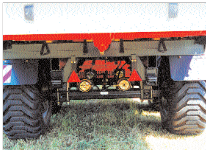
OBR. 5 SAMOSBĚRACÍ VOZY PÖTTINGER JUMBO POUŽÍVAJÍ TANDEMOVOU BRZĚNOU NÁPRAVU

Sběrací vozy Jumbo od firmy Pöttinger jsou díky popsanému