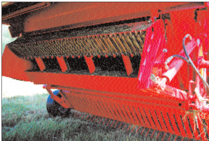
OBR. 3 NONSTOP JISTĚNÍ JISTÍ KAŽDÝ Z NOŽŮ SAMOSTATNĚ