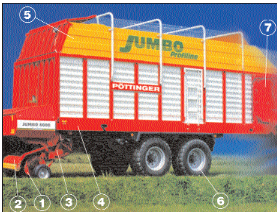
1) SBĚRACÍ ÚSTROJÍ MÁ ŠEST ŘAD OBOUSTRANNĚ VEDENÝCH SBĚRACÍCH PRSTŮ. 2) PŘÍTLAČNÝ PLECH S VKLÁDACÍM KOLEČKEM. 3) SEZACÍ ÚSTROJÍ UMOŽŇUJE DOSÁHNOUT DÉLKY ŘEZANKY VHODNĚ PRO SENÁŽOVÁNÍ. 4) RÁM STROJE JE ROBUSTNÍ. ZÁKLADNÍM SPOJOVACÍM PRVKEM JSOU ŠROUBOVÉ SPOJE. 5) LOŽNÝ PROSTOR MÁ OBJEM 60 AŽ 72 M 3 PODLE TYPU SAMOSBĚRACÍHO VOZU. 6) TANDEMOVÁ NÁPRAVA MŮŽE BÝT NA PŘÁNÍ VYBAVENA ODPRUŽENÍM VZDUCHOVÝMI MĚCHY. 7) K VYKLÁDÁNÍ JE MOŽNO POUŽÍT VYPRAZDŇOVACÍ VÁLEČEK NEBO ZADNÍ OTEVÍRATELNOU STĚNU

Na nosníku nožů řezacího ústrojí je umístěno 45 řezacích nožů v jedné řadě. Díky rozteči nožů, která je 34 mm, a oboustrannému vedení pí-