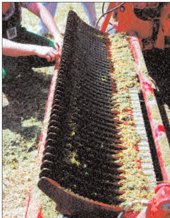
OBR. 2 ŘEZACÍ NOŽE JE MOŽNO SPOLU S NOSNÍKEM VYKLOPAT O 90° DO BOKU. PRO PŘÍPADNOU VÝMĚNU JE K NIM IDEÁLNÍ PŘÍSTUP

Podlahový dopravník na dně sběracího vozu používá čtyř vodících řetězů