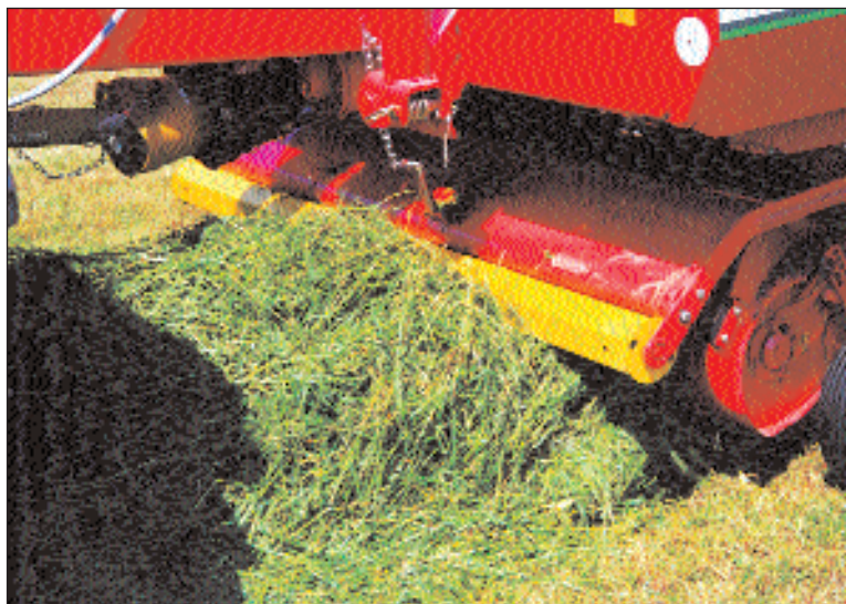
OBR. 1 POHLED NA ČINNOST SBĚRACÍHO ÚSTROJÍ SAMOSBĚRACÍCH VOZŮ JUMBO FIRMY PÖTTINGER

se nachází přítláčný plech s vkladacím válečkem. Sběrací ústrojí má možnost výkyvu ve všech směrech, aby co nejlépe kopírovalo případné nerovnosti povrchu pozemku. Pohon sběracího ústrojí je zajištěn pomocí uzavřené převodovky s ozubenými koly, která je vybavena vypínací automatikou. Celé sběrací ústrojí je přitom možno lehce demontovat a vůz poté používat jako přepravní návěs.